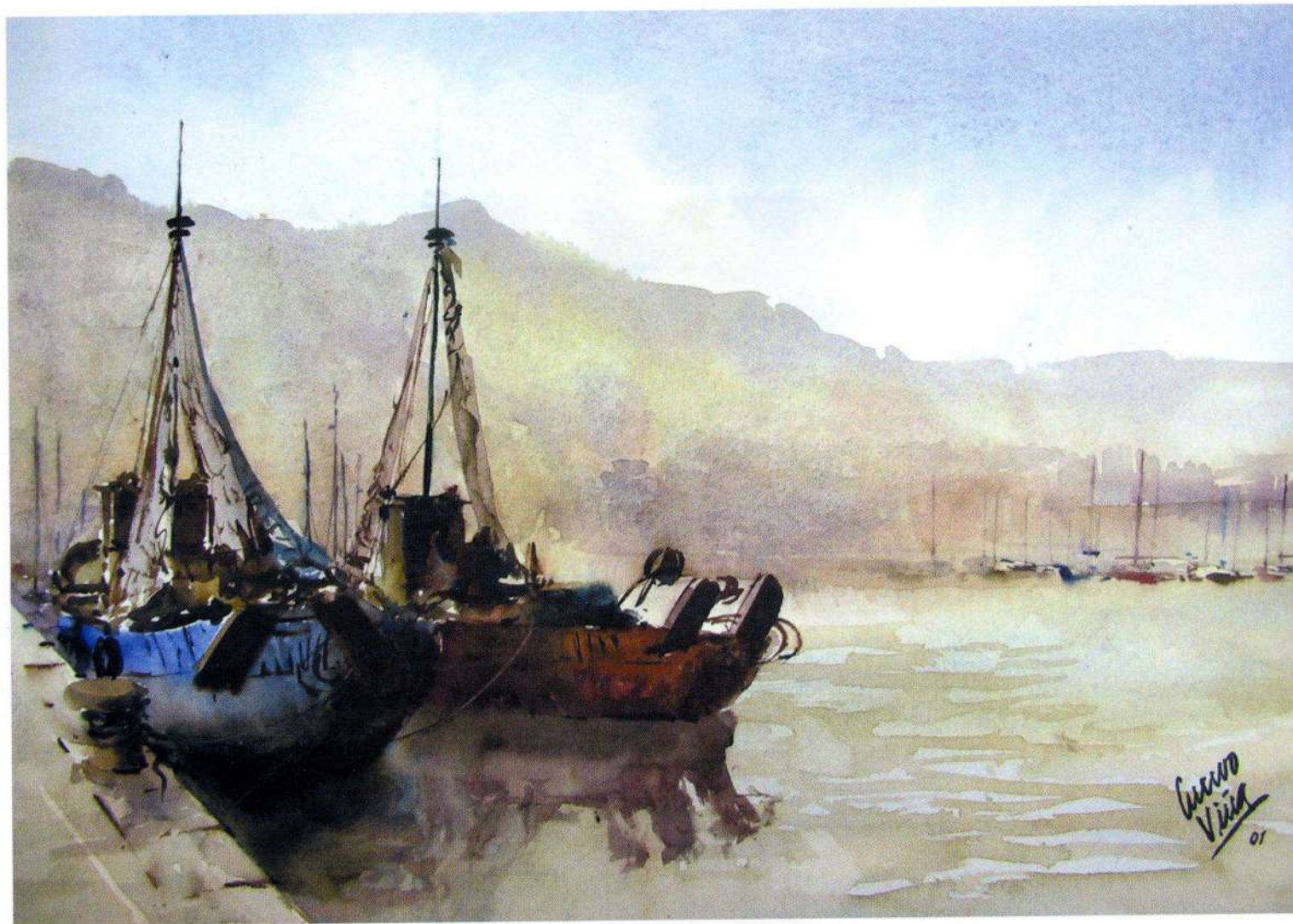
JAVEA 25 x 35 cm.