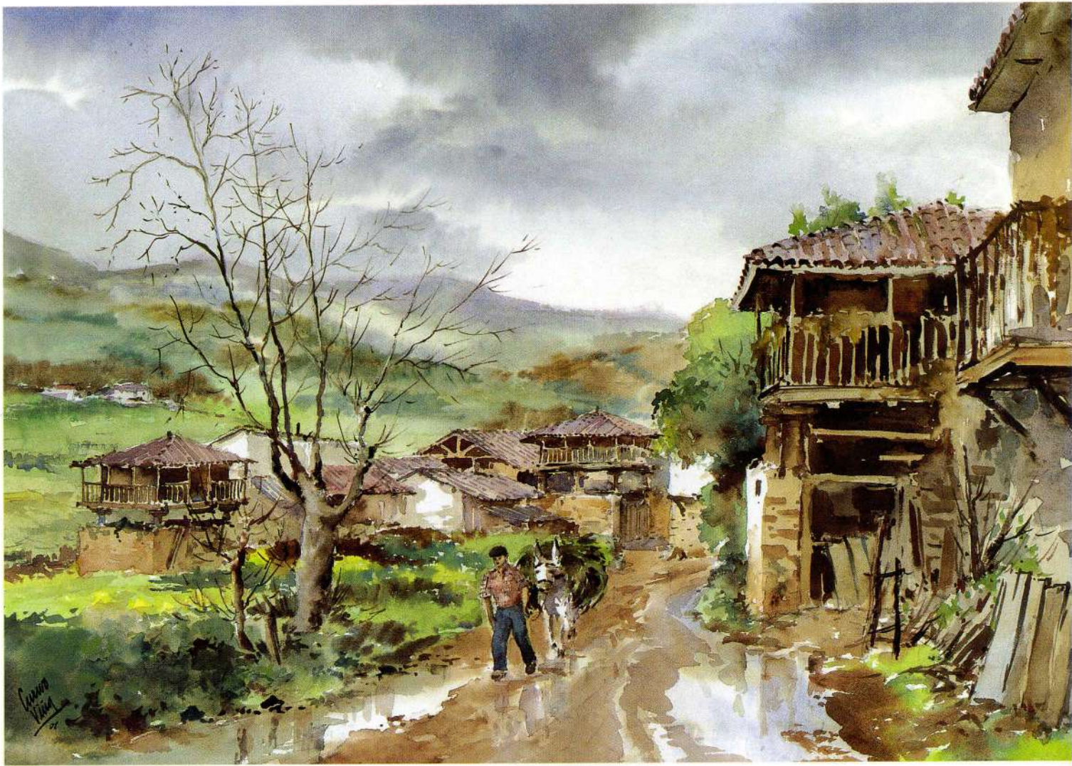
ALLECE 46 x 66 cm.