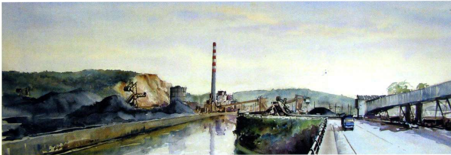
ABOÑO 25 x 73 cm.

Hoy este carbón, sangre de tierra herida, reclama su esencia negra, y es la mano del pintor quien se la niega, quien arroja a la desmesura de su cuerpo desordenado trozos de ese cielo azul,