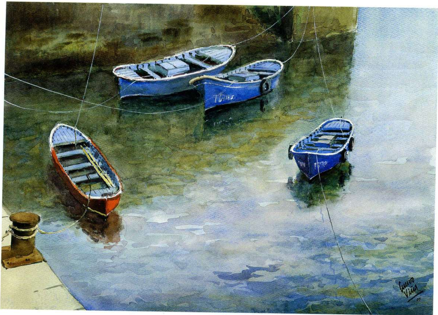
MUELLE DE CANDÁS 46 x 66 cm.