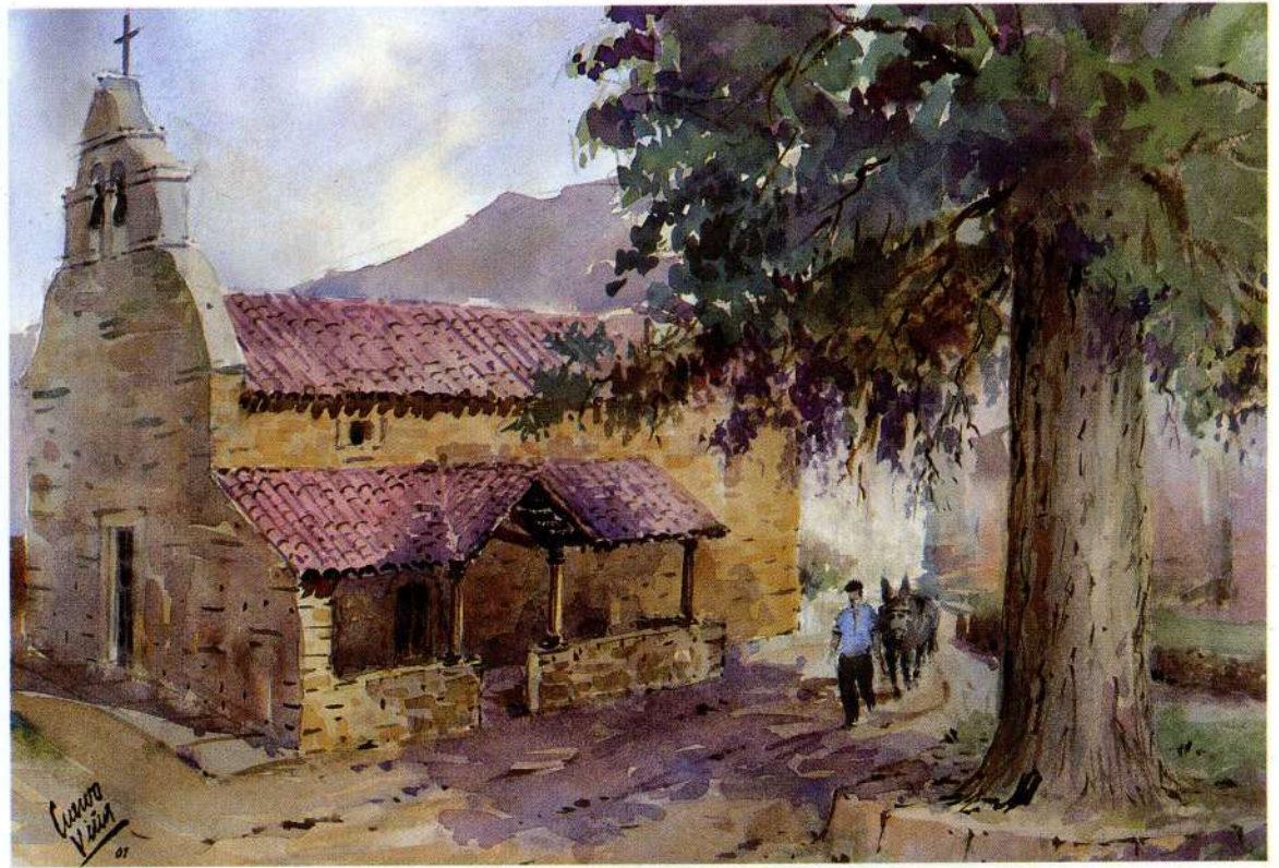
LA RIERA 32 x 46,5 cm.

Arboles, casas y espadañas también se separan de este suelo. Todos miran a quien siempre está sobre ellos y nunca tocan, le preguntan si es cielo de hoy o de mañana, y cuando éste les da lugar en el tiempo, inquietan temerosos si es cielo de gris nube de agua o cielo de luz iluminada, porque si hoy es todo luz, ellos tendrán sombra malva que los una, y por ella bajarán al suelo para contarse la historia que les une.