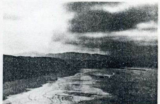
PAISAJE (ALFREDO NOVAL)