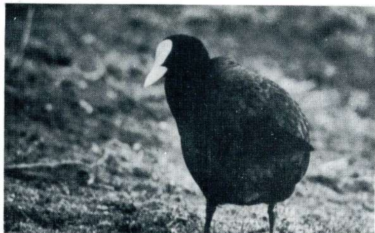
FOTO 1 Gallineta real o Focha común Fulica atra .