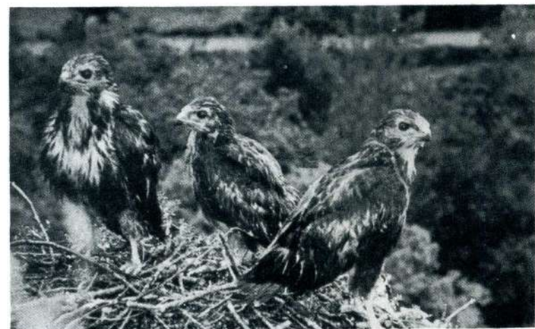
FOTO 7 Jóvenes de Pardón, Milán calcabalagares o Ratonero común Buteo Buteo .