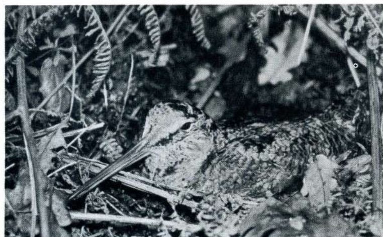
FOTO 6 Arcea o Chocha perdiz Scolopax rusticola en el nido.